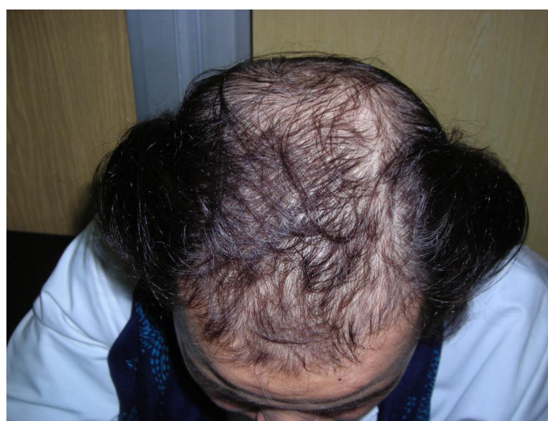
Fig.1 : Alopécie androgénétique associée à un hirsutisme chez une patiente ayant un déficit en 21 hydroxylase

La testostéronémie libre était élevée chez 11 patientes. Le syndrome des ovaires poly-kystiques était l'étiologie la plus fréquente(40%), puis l'hirsutisme idiopathiques (31%), le reste [bloc 21hydroxylase (figure 1), hyperinsulinisme, adénome hypophysaire, hyperprolactinémie..](n=13).