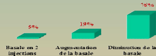
Figure 1: les résultats de l'ajustement de l'insuline basale au cours de l'épreuve de jeun.

Résultats : 28 patients ont été colligés d'âge moyen de 18 \pm 6 ans, déséquilibrés avec une moyenne d'HbA1c de 8,2 \pm 1,6\% . la durée de diabète était de 6 \pm 4 ans. 82% des patients avaient des hypoglycémies mineures à raison de 12 fois par mois et dont le chiffre le plus bas était d'une moyenne de 0,4 g/l. l'épreuve de jeun faite au cours de l'hospitalisation a permis un ajustement de l'insuline basale [Figure. 1]. Le programme de l'insulinothérapie fonctionnelle a permis une réduction des l'hypoglycémies chez 67% des cas et une amélioration de l'HbA1c avec un \Delta de 0,8% ( 8,2 \rightarrow 7,4\% ) [Figure. 2]. En terme de gain pondéral, une prise de poids d'une moyenne de 2kg a été noté chez 14% des cas, néanmoins, 86% des patients ont gardé un poids stable.